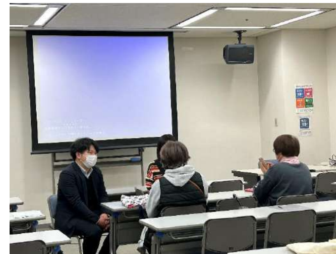
セミナー後の相談（羽曳野市）