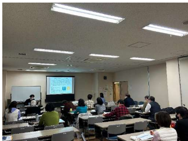
セミナー風景（箕面市）