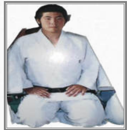
19年前。柔道一路でした